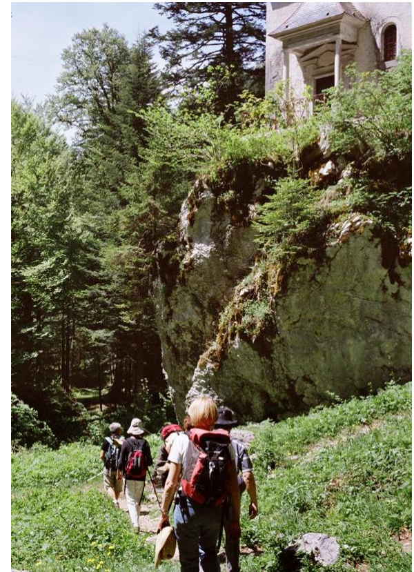
Forêt de Grande Chartreuse

Document qui explicite les conditions d'éligibilité et la démarche, il donne la tonalité du projet à construire, définit les critères d'attribution du label