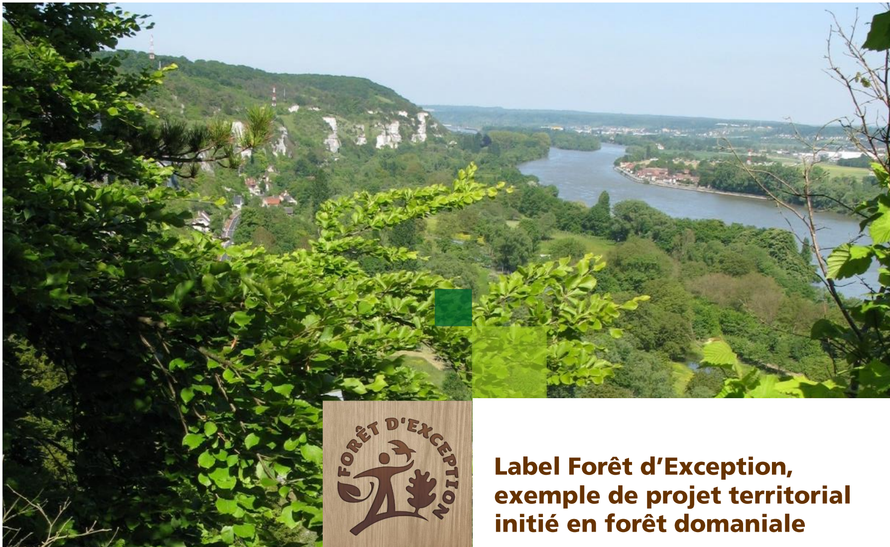
Forêts de Rouen, boucles de la Seine